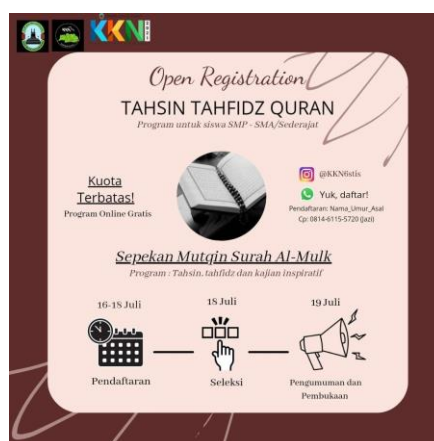
Gambar 2. Pamflet Open Registrasi Program