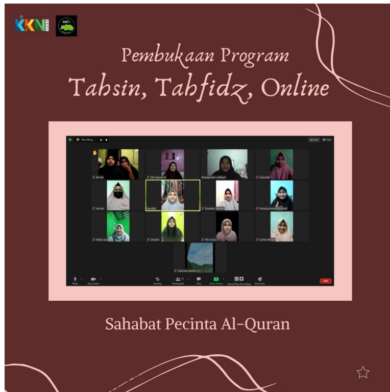
Gambar 3. Pembukaan Program Tahsin, Tahfidz Online

Pendekatan adaptif seperti ini selaras dengan rekomendasi literatur bahwa pembelajaran tahfidz daring harus mengedepankan fleksibilitas media dan waktu untuk menjaga motivasi peserta (Heriyanto, 2024).