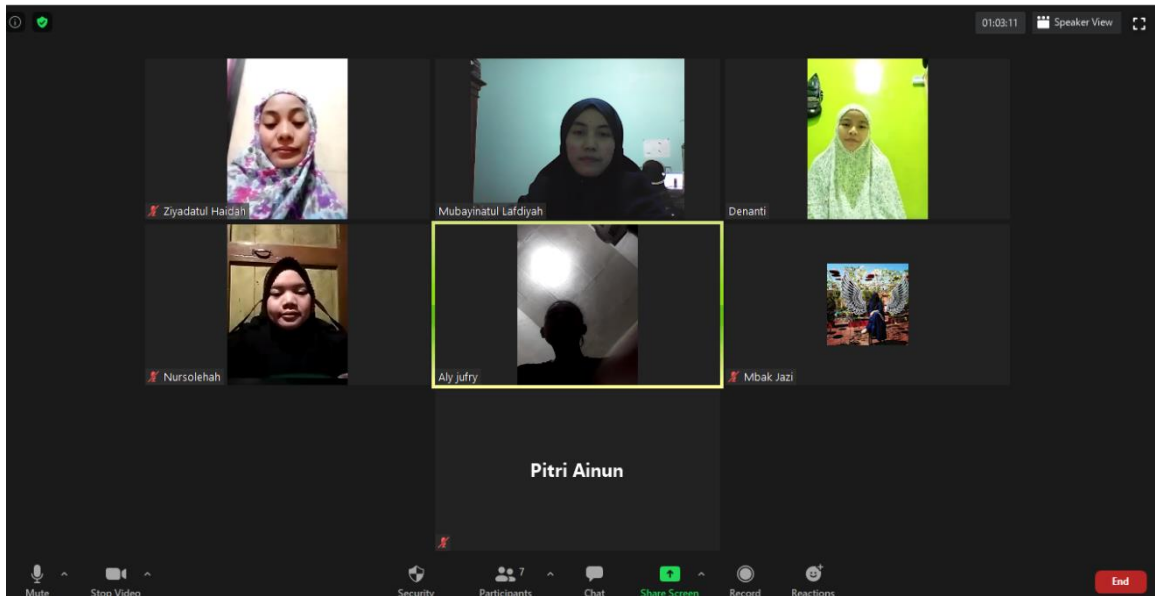
Gambar 1. Rapat Membahas Teknis

Selain itu, beberapa musyriyah terlambat mengirim laporan harian. Keterlambatan ini menghambat proses pemantauan dan menurunkan efektivitas monitoring. Keterlambatan pelaporan menjadi salah satu tantangan yang sering ditemukan pada program tahfidz berbasis daring (Pasaribu, 2022). Namun, program ini berhasil mengatasinya melalui pengingat personal oleh PJ. Program menerapkan beberapa strategi adaptasi, di antaranya: